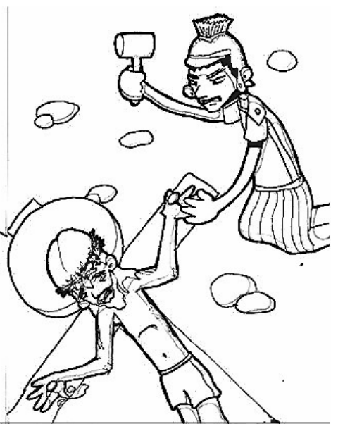
11º ESTACIÓN: JESÚS ES CLAVADO EN LA CRUZ