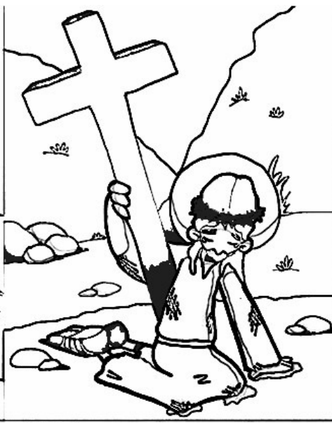
7º ESTACIÓN: JESÚS CAE POR SEGUNDA VEZ