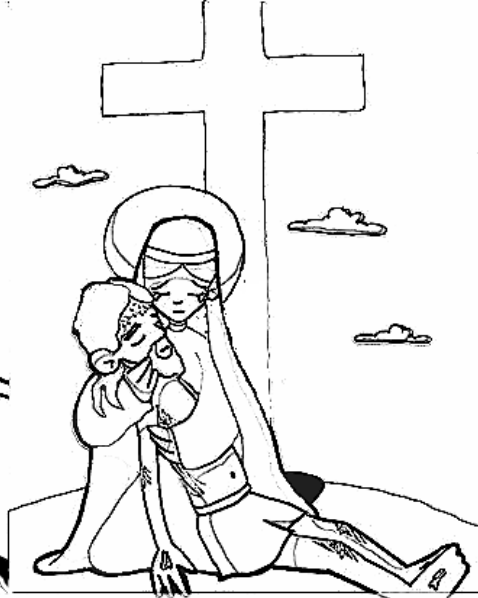
13º ESTACIÓN: JESÚS ES BAJADO DE LA CRUZ