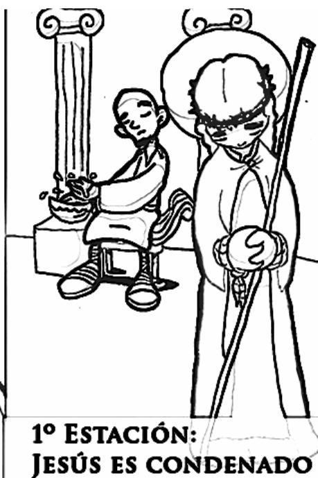
1º ESTACIÓN: JESÚS ES CONDENADO