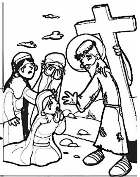
8º ESTACIÓN: JESÚS CONSUELA A LAS MUJERES DE JERUSALÉN