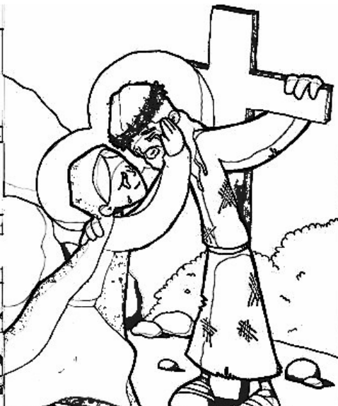
4º ESTACIÓN: JESÚS SE ENCUENTRA CON SU MADRE