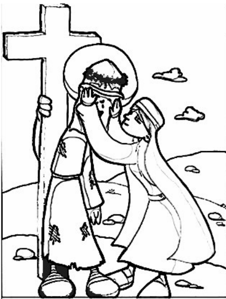
6º ESTACIÓN: LA VERÓNICA ENJUGA EL ROSTRO DE JESÚS

(Colorea estos dibujos. Puedes recortar y poner cada estación o en rollo de papel...)