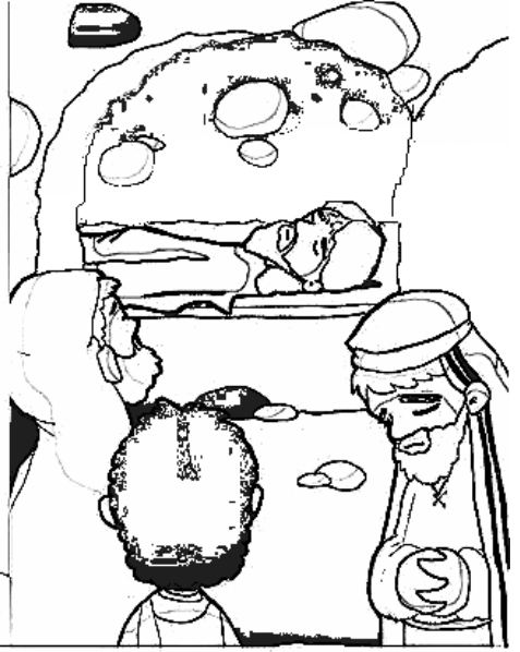
14º ESTACIÓN: JESÚS ES SEPULTADO