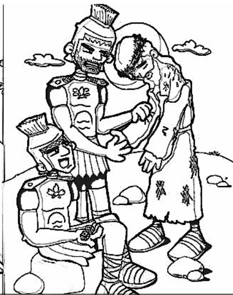
10º ESTACIÓN: JESÚS ES DESPOJADO DE SU ROPA