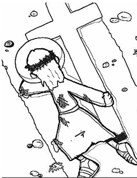
9º ESTACIÓN: JESÚS CAE POR TERCERA VEZ

(Colorea estos dibujos. Puedes recortar y poner cada estación o en rollo de papel...)