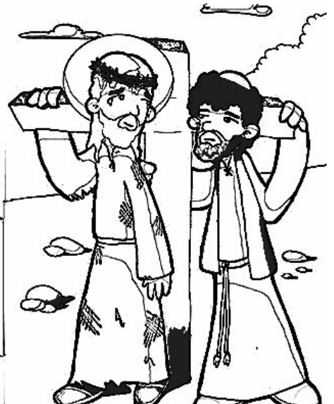
5º ESTACIÓN: EL CIRENEO AYUDA A JESÚS A CARGAR LA CRUZ