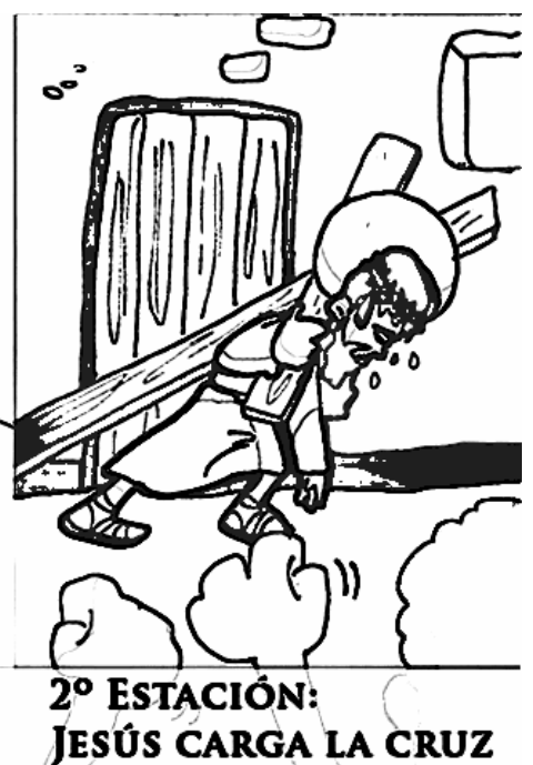
2º ESTACIÓN: JESÚS CARGA LA CRUZ